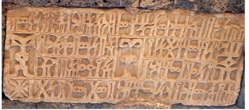
جربإعادة استخداممضمن أحد المنازل بمنطقة بيت الأشول محافظة إب يظهر كتابة مزخرفة بطريقة Gar BSE الصورة 9 : النقش مميزة جداً