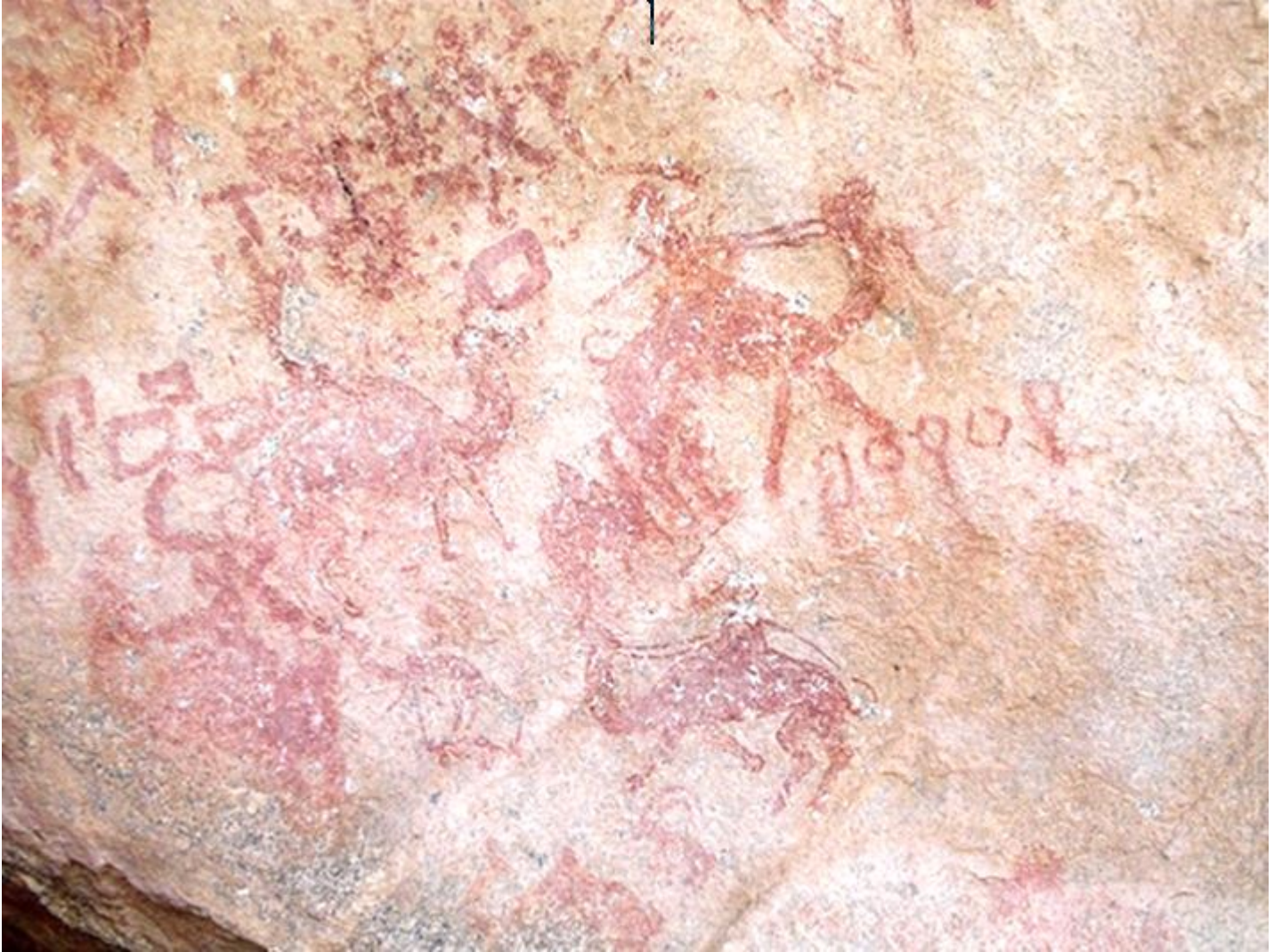
الصور 1, 2 : نقوش ورسوم مكتوبة باستخدام راتينج الأشجار – كهف الميفاع – محافظة البيضاء

وهكذا نجد بأنه لم يقتصر استخدام المُسند على اليمنيين فقط، بل يمكن القول بأن المُسند اليمني مثل نظام الكتابة الأوحد والأول في شبه الجزيرة العربية واشتق منه عدد من الخطوط التي استخدمت في لغات داخلية وخارجية قديماً. وبهذا يستحق المُسند أن يطلق عليه لقب السفير الذي حمل بين ثنايا حروفه إرث وتراث وثقافة اليمنيين وعمل على نشرها داخل وخارج شبه الجزيرة العربية.