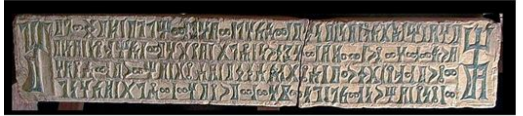
من محفوظات المتحف الوطني بصنعاء يظهر شكل مميز من أشكال الحروف المزخرفة 1 DJE 12 Graf الصورة 7 : النقش