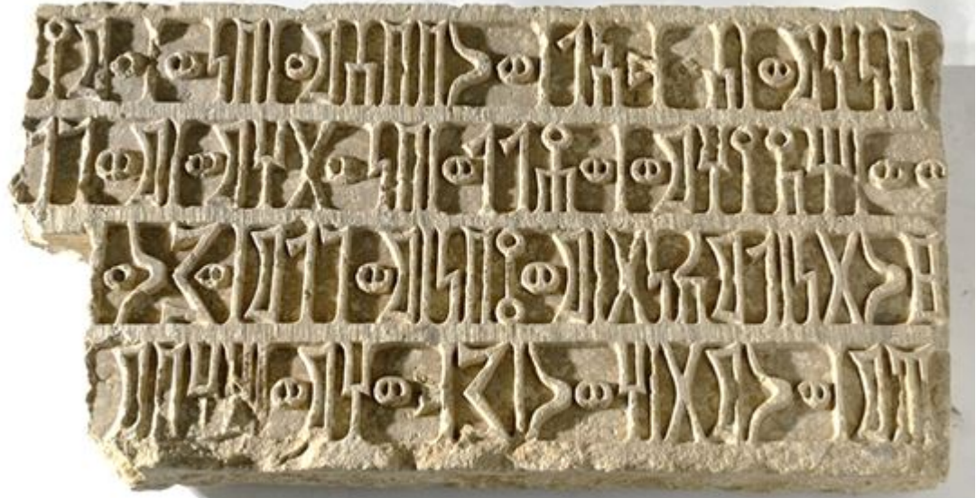
من محفوظات متحف الفنون الشرقية - روما - ايطاليا يظهر الكتابة بطريقة النحت المتداخل RES 4705 الصورة 6 : النقش