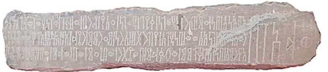
من محفوظات متحف بني بكر - يافع يظهر شكلمميز للحروف المزخرفة 7 BaBa al-Hadd الصورة 8 : النقش