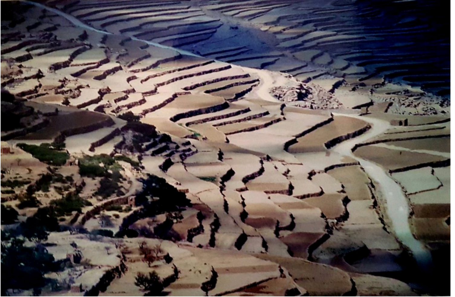
ثلا) في محافظة عمران 2000م)