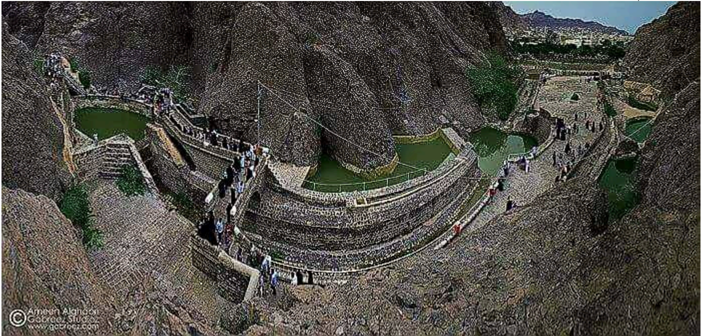
صهاريج عدن 2010