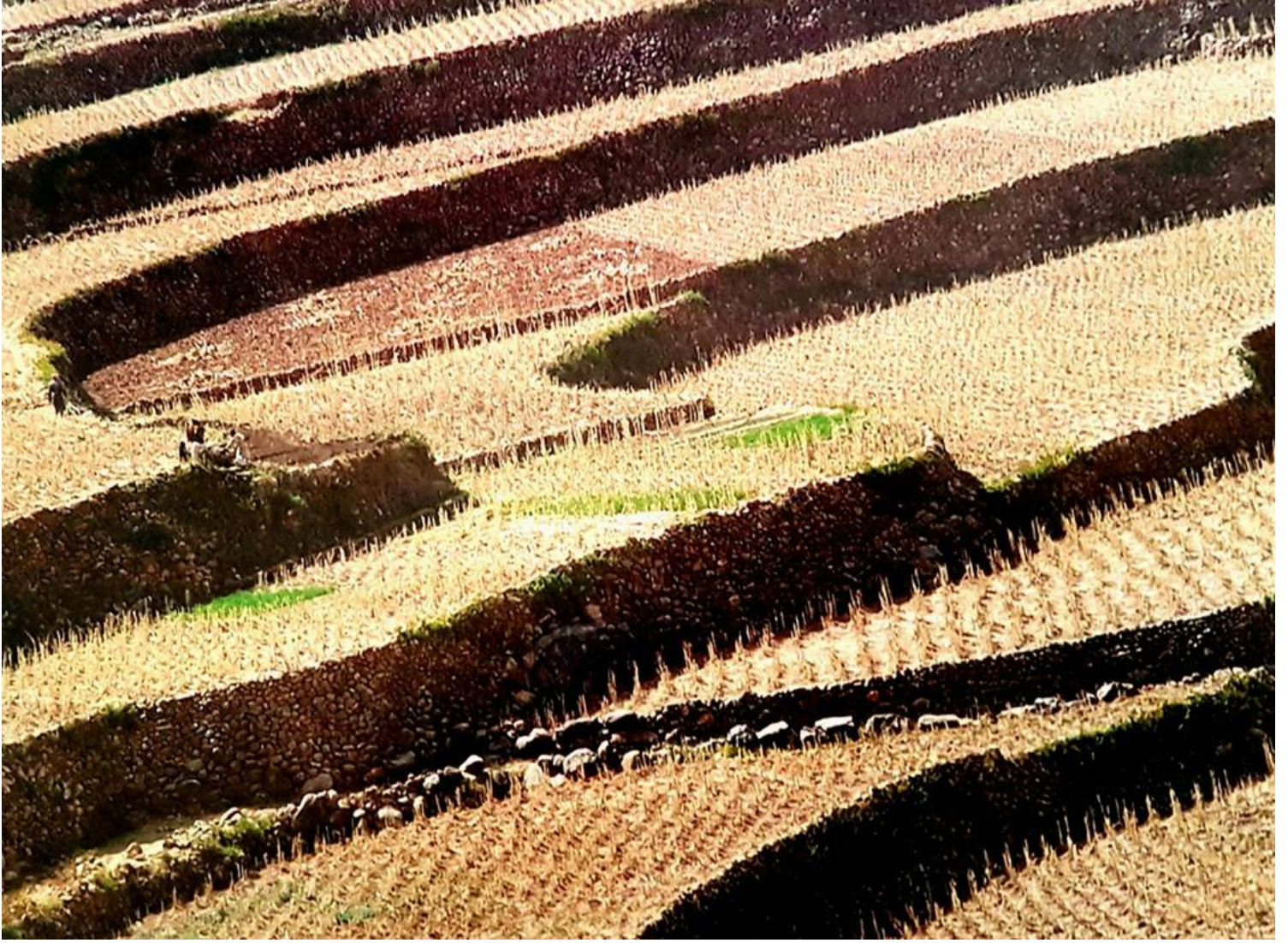
حقول، محافظة المحويت 2001م