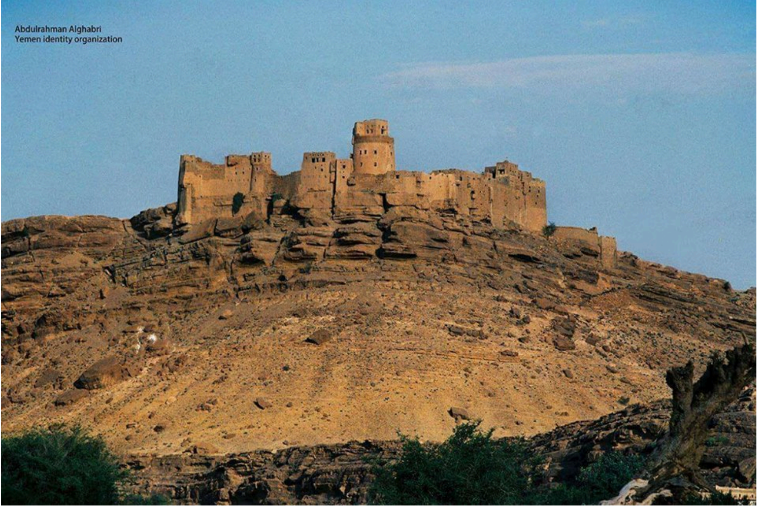
القلعة الحميرية (السنارة) صعدة 1996م