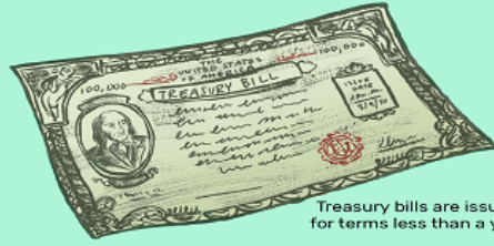
Treasury bills are issued for terms less than a year

The difference between bills, notes, and bonds are the lengths until maturity