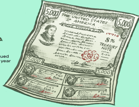
Treasury notes are issued for terms of two, three, five, and 10 years