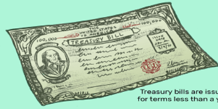
Treasury bills are issued for terms less than a year

The difference between bills, notes, and bonds are the lengths until maturity