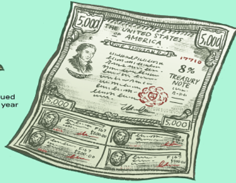
Treasury notes are issued for terms of two, three, five, and 10 years